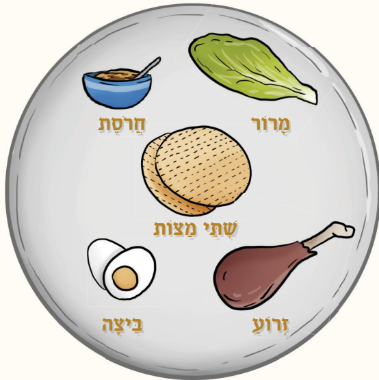
לדעת הגר'א זצ"ל: